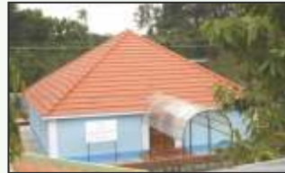
द ग्रेट रा मेडिटेशन हॉल