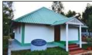
गुरुजींची पवित्र रक्षा